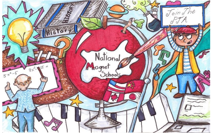
အမျိုးသား မက်ဂနက်ကျောင်း လ - ဖေဖော်ဝါရီ ၂၀၁၉ တစ်နိုင်ငံလုံးတွင် ဗိုလ်စွဲသူ အမေရိက မက်ဂနက် ကျောင်းများ ပိုစတာ ဖြိုင်ပွဲ ဗိုင်းအာ၊ ရွာနန်း ချက်တို ကျောင်း

ထပ်ဆောင်း အချက်အလက်အတွက် ကျောင်းအုပ်ကြီး၏ စည်းကမ်း ဖြေဖတ် ကိုကြည့်ပါ။