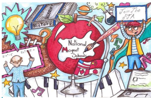
Национальный месячник специализированных школ (Magnet Schools) — февраль 2019 г.

(Дополнительную информацию см. в установленном старшим инспектором Правиле 6400)